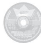
Brousicí a řezací kotouče