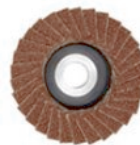
Brousicí lamelové kotouče