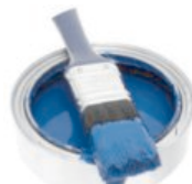
Barva, lak, tmel