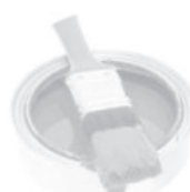
Barva, lak, tmel