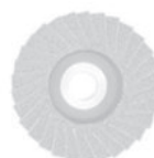
Brousící lamelové kotouče