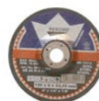
Brousící a řezací kotouče