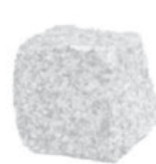
Kámen, sklo, keramika